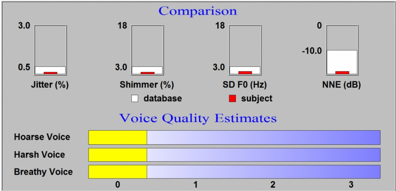
Şekil 3 : Postoperatif RBH değerlendirilmesi (Roughness, Breathiness, Hoarseness)

Vocal Assesment Analysis bölümü kullanılarak, RBH (Roughness; Sesteki pürüzlülük, Breathiness; Solukluluk, Hoarseness; Ses kısıklığı) sistemine benzer bir sistemde değerlendirme yapıldı. RBH değerlendirilmesi sadece postoperatif dönemde yapılabildi (Şekil 3).